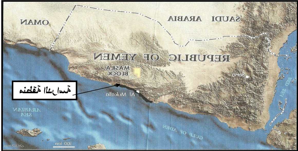
(2009) خیتنظا نسنه خلیشه : یسحما

. لالمش 14 20 و 14 2 ریخه ریخه لقیش 02 02 و 04 84 لامله ریخه زبید لقیش